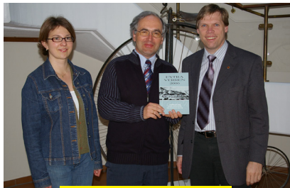
Erste Ausgabe 2006

Die Ausgabe 2025 ist der zwanzigste Jahrgang des Jahrbuches des Museumsvereins Reutte und damit ein Jubiläumsband. Wie ich im Vorwort der ersten Ausgabe geschrieben habe, wollen wir mit dieser jährlich erscheinenden Publikation Artikel über die Geschichte, Kulturgeschichte und die Kunst des Außerferns zusammentragen und in Buchform herausgeben. Wichtig war uns damals auch, neue Erkenntnisse und