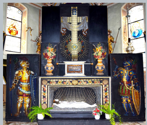
Bild: In der zweiten Hälfte des 19. Jahrhunderts entstand das Heilige Grab in Stanzach als beleuchtetes Glas-Mosaik-Grab.

Ein besonderes Heiliges Grab hat sich in der Expositurkirche St. Michael in Stanzach erhalten. Es entstand in der zweiten Hälfte des 19. Jahrhunderts durch die Firma Eduard Zbittke aus Olmütz. Der Kaufpreis betrug damals laut Katalog 10.550 Kronen. Es handelt sich um ein von hinten beleuchtetes Glas-Mosaik-Grab und hat vier Hauptteile: ein Grabesraum mit dem Grableger, zwei Seitenteile mit je einem Ritter als Grabwächter und einer hochgestellten Haupttafel mit einem Kreuz mit weißen Glassteinen. Unter dem Kreuz befindet sich eine Bundeslade mit einem Trägerstab. An den Seiten sind verzierte leuchtende Blumenvasen.