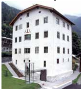
Turmmuseum in Oetz

Am Freitag den 27. Jänner 2023 lud der Museumsverein zusammen mit dem Seniorenbund Ortsgruppe Reutte zu einem Halbtagesausflug ins Ötztal ein. Ziel war das Turmmuseum in Oetz wo heuer seit längerer Zeit wieder die historischen Weihnatskrippen der Sammlung Jäger ausgestellt wurden.