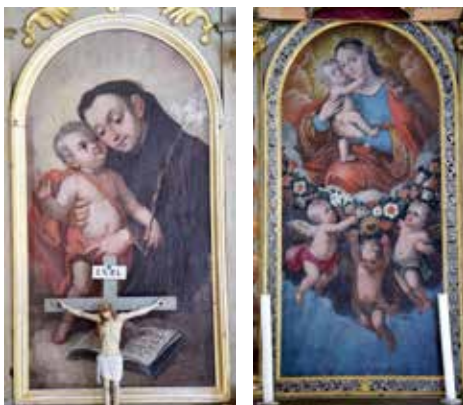
„Maria-Hilf-Bild“ von Paul Zeiller am Hochaltar in Kelmen (um 1718).