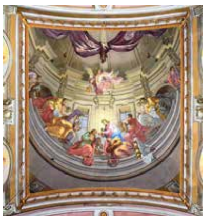
Chorfresko der „Apostelkommunion“ (1804) in der Pfarrkirche von Tannheim